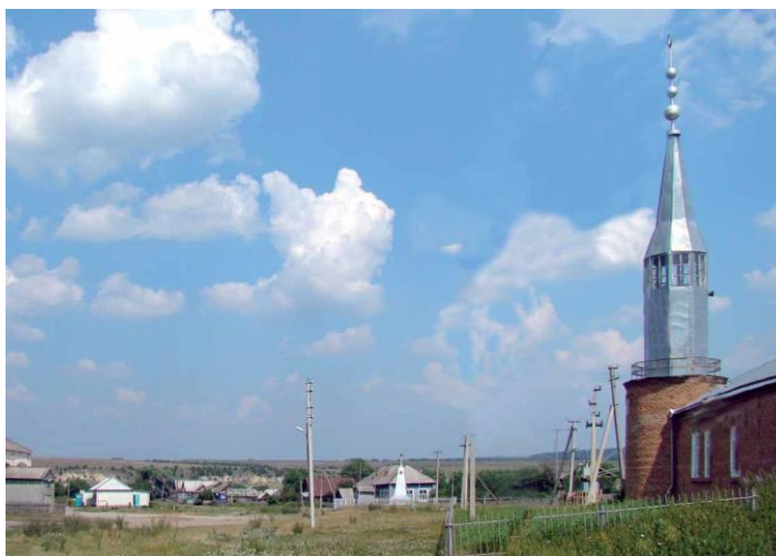
Рис. 3. Мечеть в Татарском Саймане

Мусульмане имеют партнерские отношения не только с последователями православного вероисповедания, но и дружелюбны с адептами еще одного религиозного течения на территории региона - иудеями.