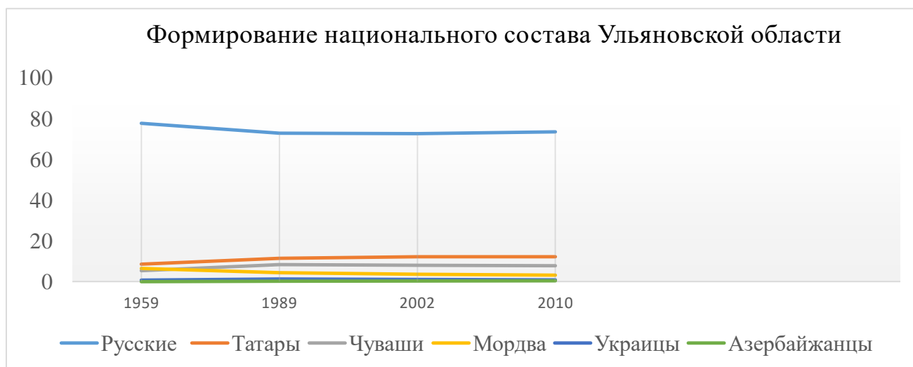
Рис. 1. Формирование национального состава Ульяновской области [составлена автором]

В диаграмме представлено формирование национального состава Ульяновской области (рис. 1.).