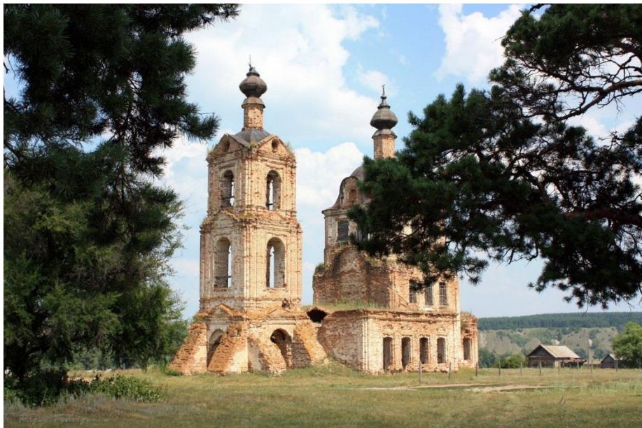
Рис.2. Церковь Покрова Богородицы

Кроме каменной, в селе была и деревянная церковь, место, где она была воздвигнута не известно. «Церковь Покрова Пресвятой Богородицы» вошла в список выявленных объектов культурного наследия (памятников истории и культуры) Распоряжением Главы администрации Ульяновской области. В настоящее время администрациями муниципального района и поселения, а также местными жителями самостоятельно проведены работы по консервации объекта.